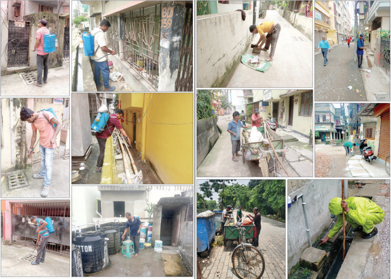
ডেঙ্গু, মার্শেরিয়া, চিকুনগুনিয়ার হাত থেকে রক্ষা পাওয়ার জন্য ২৪ নম্বর ওয়ার্ডকে, চার তাপে আগ করে প্রতিদিন এক একটি গ্রাউন্ড মশার ওষুধ স্প্রে করা হয়। প্রতিনিয়ত মশার ওষুধ স্প্রে করার ফলে ওয়ার্ডের প্রতিটি মানুষের বক্তব্য মশা প্রায় সেই বললেই চলে। আর বিভিন্ন হোট বড় বাজায় ঢাকা নর্মালা হওয়ার ফলে কেউ নর্মালায় ময়লা ফেলতে পারলে না আর মশার জন্মের অনুকূল পরিবেশও তৈরি হতে পারবে না। সকলকে অনুরোধে নিজের বাড়ির চারপাশ সর্বদা পরিষ্কার রাখুন।